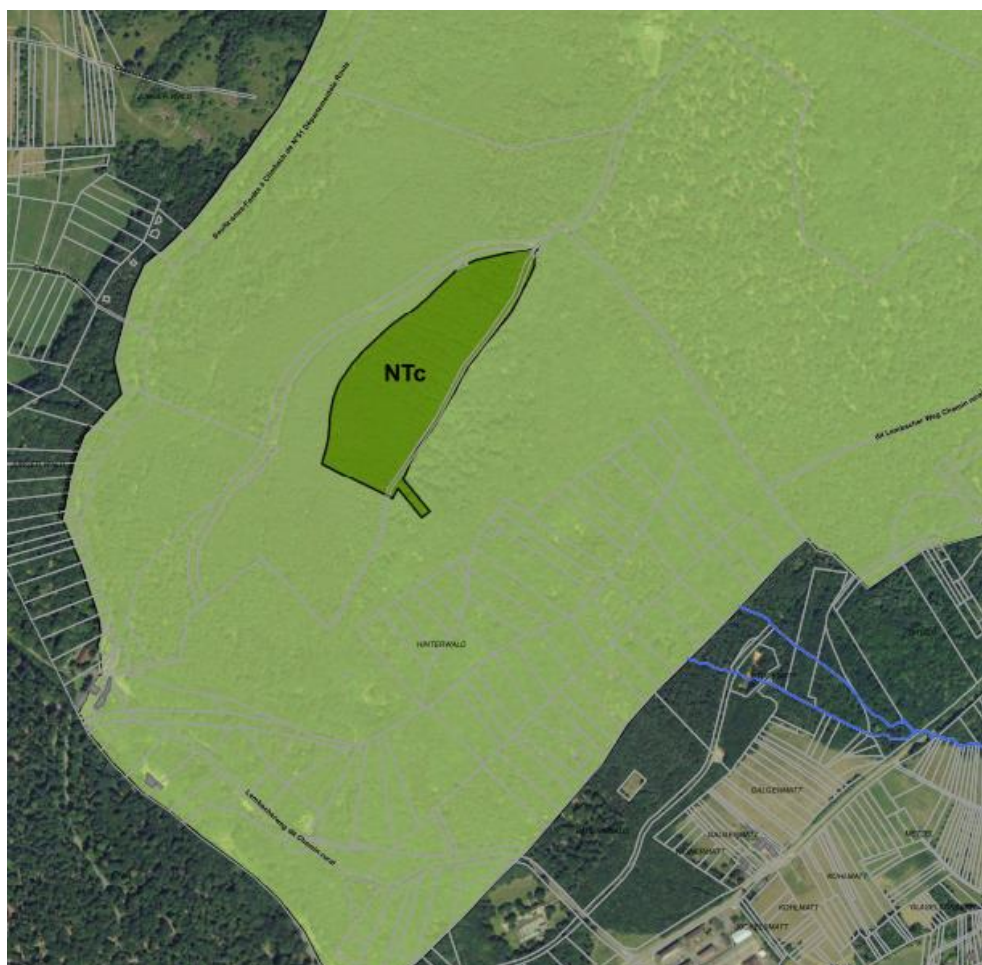
Extrait du plan de zonage présentant le secteur NTc